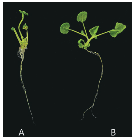
Рис. 2. Развитие растений-регенерантов на 30 день культивирования на питательной среде: А – типичный проросток в контрольном варианте при культивировании эмбрионов при +22°C; Б – растение-регенерант, образовавшееся в результате прямого прорастания эмбриода, при воздействии на эмбриоды низкой положительной температурой +1°C в течение 6 дней

Кислотность питательной среды влияет на скорость протекания биохимических реакций, усвоение питательных веществ клетками экспланта, степень токсичности ингибиторов роста, плотности геля и на другие свойства питательной среды. Исследования Yuan et al. [20] показали, что повышение уровня pH эмбриоиндукционной питательной среды NLN-13 увеличивало частоту эмбриогенеза у различных генотипов капусты белокочанной. Наши исследования демонстрируют влияние pH питательной среды на продолжительность формирования проростков из эмбрионов, а также на общую частоту их регенерации. Увеличение уровня pH среды до 6,1 перед автоклавированием оказало положительное влияние на регенерацию проростков