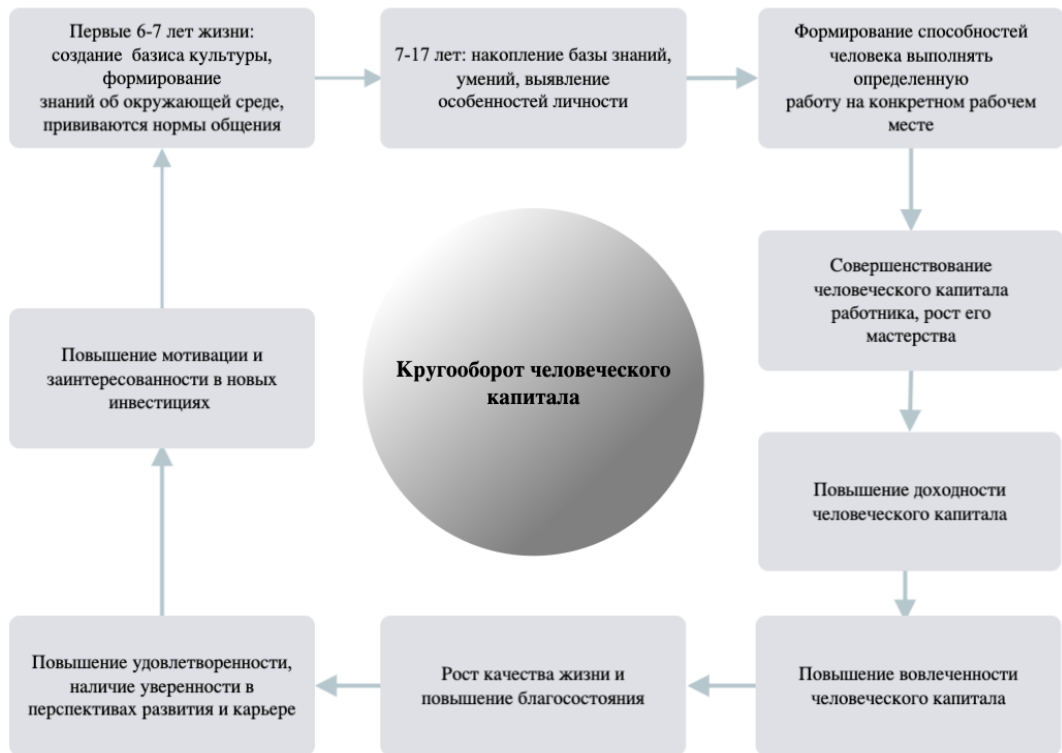
Рис. 1. Стадии функционального кругооборота человеческого капитала

Инвестирование в человеческий капитал является одной из ключевых стадий его кругооборота и включает в себя вложения как в знания и навыки человека, так и в качество его жизни в сфере сельскохозяйственного производства (рис. 1).