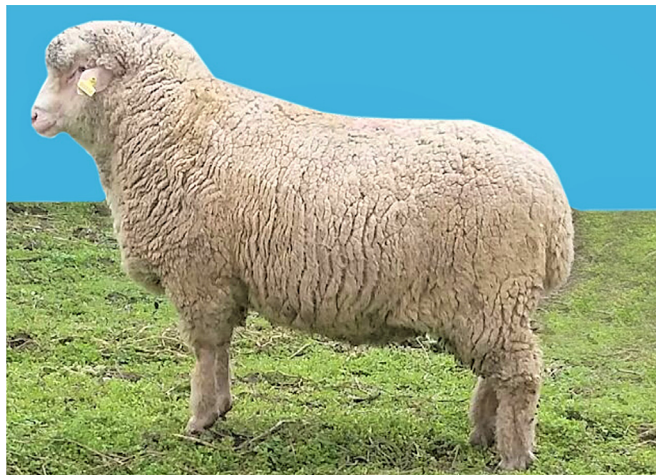
Рис. 2. Баран-производитель породы артлухский меринос (3 года): живая масса – 111 кг; настриг мытой шерсти – 6,1 кг