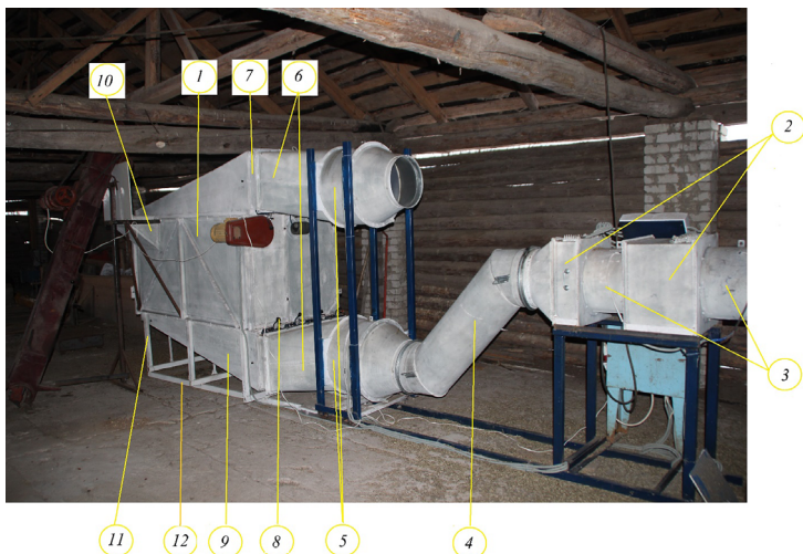
Рис. 1. Сушилка УС-0,35: