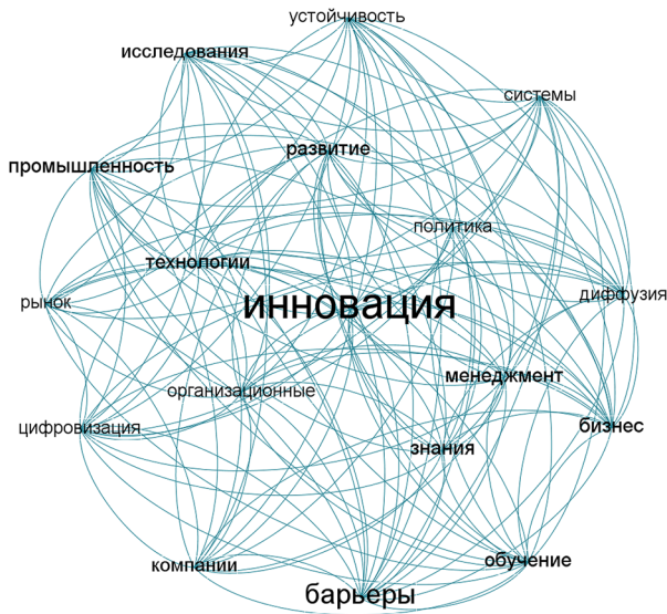
Рис. 2. Визуализация аналитических данных 3487 публикаций из базы цитирования Scopus за 1972–2022 гг., семантического поля «Барьеры инновационного развития», 26 апреля 2022 г. (составлено автором по результатам исследований)