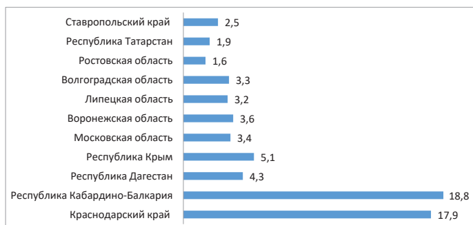
Рис. 2. Доля регионов-лидеров в общероссийском объеме производства семечковых культур по итогам 2021 г., % (составлено автором [1])

Стоит отметить и тенденцию роста потребления, которое в 2020 г. составило 76 кг на душу населения. Несмотря на то, что уровень установленных рациональных норм потребления (90–100 кг в год на 1 чел.) не достигается, он все же больше, чем в других российских регионах и в целом по стране, и составляет 61 кг [4].