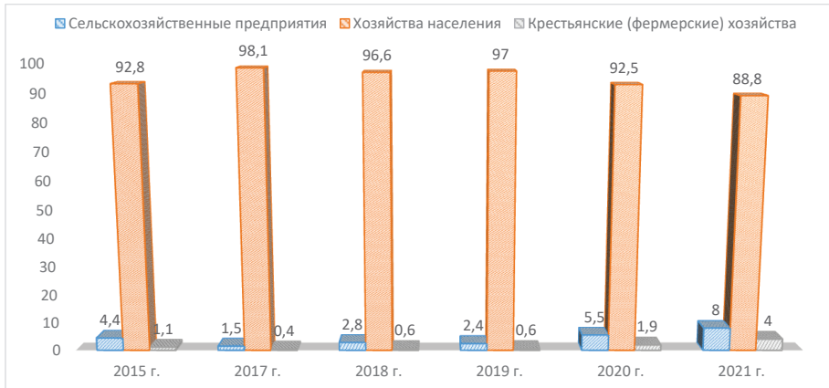
Рис. 3. Динамика структуры производства плодово-ягодной продукции по категориям хозяйств, % (составлено автором [1])

Но значительная часть плодово-ягодной продукции производится в личных подсобных хозяйствах (ЛПХ) – 88% (рис. 3), что не может не сказаться на экономической отсталости подотрасли, примитивности технологий, неэффективности производства, неспособности к крупным технико-технологическим преобразованиям.