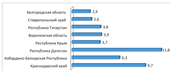
Рис. 1. Доля регионов-лидеров в общероссийском объеме производства косточковых культур по итогам 2021 г., % (составлено автором [1])