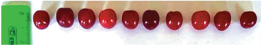
Рис. 2. Плоды вишни войлочной

По данным Н.Н. Коваленко, в среднем по виду диаметр плодов колеблется от 1 до 1,5 см, масса составляет 1,5–2,5 г. Биохимические показатели плодов имеют широкое варьирование в зависимости от формы. Суммарный процент сахара в плодах находится в пределах 7,2–13,8 [3]. В проведенных нами исследованиях длина и диаметр плода варьируется в пределах 1,1–1,2 см (рис. 2), масса плода – 0,9 г, количество сахаров в плодах в среднем составляет 10°Вх. При этом изменчивость плодов не превышает 6%, что говорит об их однородности.