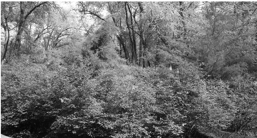
Рис. 3. Загущение ЗЛН в Волгоградской области

По категории лесопригодности почвы сухостепной зоны 1 категории составляют 21–38% от общей территории, 1/3 ее площади относится к условно лесопригодным.