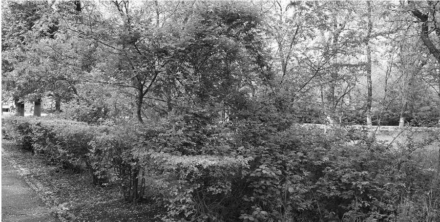
Рис. 2. Состояние защитных лесных полос в Волгоградской области

содержатся на глубине 2 метра, корнеленепроницаемые экраны – на глубине 1–2 м, содержание солонцов составляет 25%. На почвах III группы рациональнее всего использовать кустарниковые кулисы с высокой засухо- и солеустойчивостью [8, 9].