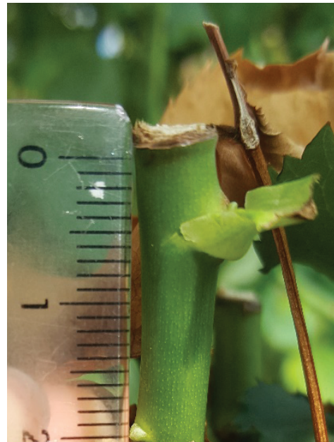
Рис. 2. Пробуждение почки у розы сорта Red Naomi в середине ряда

Для определения скорости нарастания побега исследовали его длину через 7 и 14 дней после пробуждения почки. Наблюдения проводили за каждым сортом роз в зависимости от места расположения в теплице и технологической операции «отгиб листа». Выявлено, что побег у розы сорта Grand Prix в начале ряда через 7 дней после пробуждения почки достиг 35 мм, через 14 дней его длина составила 60 мм. Побег сорта Red Naomi через 7 дней после пробуждения почки достиг 30 мм, через 14 дней