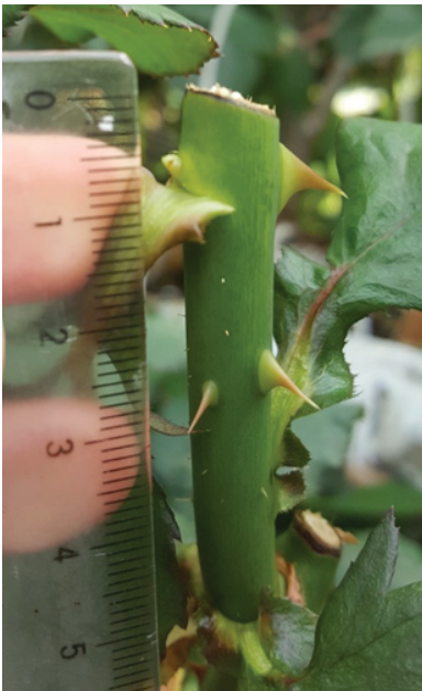
Рис. 1. Пробуждение почки у розы сорта Jumilia с отгибом листа