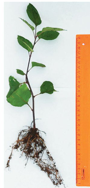
Рис. 3. Внешний вид корневой системы укорененного черенка клонового подвоя яблони 54–118, обработанного гетероауксином, при сроке черенкования 07.06.2021 г.

При пересадке укорененных черенков для последующего доращивания был проведен анализ корневой системы растений. В результате исследований установлено, что сроки черенкования в оба года не оказали существенного влияния на степень корнеобразования клонового подвоя яблони. В среднем за 2020–2021 гг. хорошая корневая система (рис. 3) получена у черенков первого срока (5 баллов).