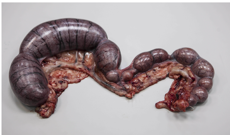
Рис. 2. Объемное увеличение рогов матки собаки при закрытой форме пиометры

Различают открытую и закрытую форму пиометры. При открытой форме наблюдают скудные или обильные катарально-гнойные, гнойные или гнойно-геморрагические выделения (цвета томатного супа) из половой петли, с неприятным запахом. На характер выделений, по-видимому, влияет видовая принадлежность возбудителя. Гнойно-геморрагические выделения, как правило, характерны для патогенной колибациллярной микрофлоры, катарально-гнойные и гнойные – для стрептококковой [27, 29]. При закрытой форме болезни (шейка матки закрыта) выделения из половой петли отсутствуют. Открытая форма пиометры встречается в 40...88,2% случаев [2, 14, 23, 34, 38, 45, 60] и характеризуется более благоприятным клиническим течением, чем закрытая ее форма [35].