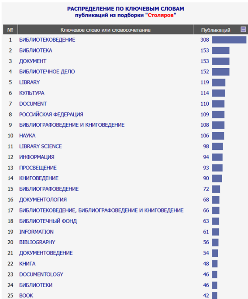
Рис. 2. Скриншот статистического отчёта распределения цитирующих труды Ю. Н. Столярова публикаций по ключевым словам (по данным РИНЦ)