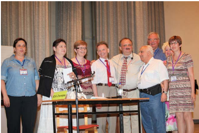
Фото 6. Участники, секунданты, дуэлянты и эксперты дуэли