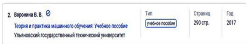
Рис. 2. Описание книги, выбранной в ЭБС «Лань»

Справа размещена панель «Список видео» с комментарием разработчиков (рис. 3): в соответствии с контекстом читаемой цифровой книги рекомендательная система 7 , встроенная в ЭБС «Лань», подбирает видеоконтент, размещённый на видеохостинге YouTube.