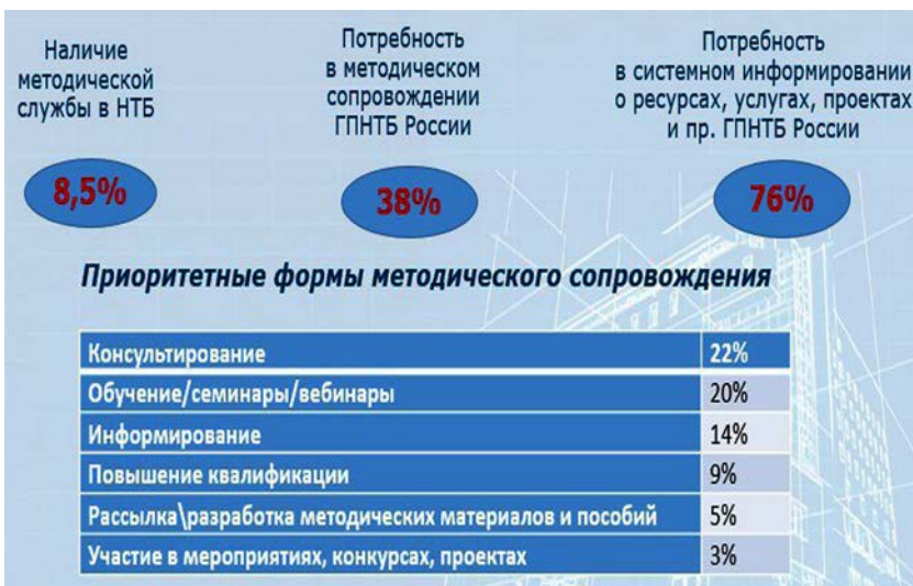
Рис. 2. Потребность в методическом сопровождении деятельности НТБ и научно-технических центров

Таким образом, предварительные итоги первого этапа всероссийского мониторинга НТБ и научно-технических центров позволили: