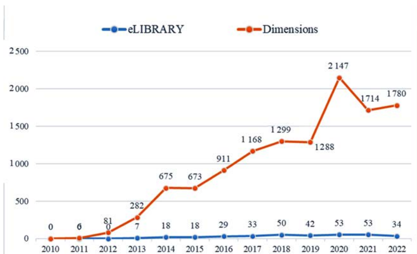
Рис. 1. Количество публикаций по альтметрике, проиндексированных с 2010 по 2022 г. в информационных системах РИНЦ (eLIBRARY) и Dimensions