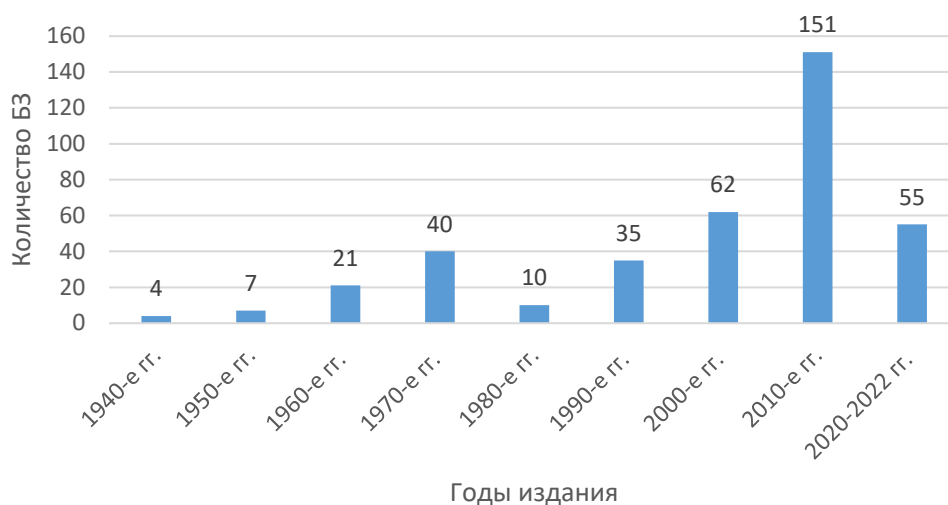
Рис. 2. Количество публикаций (по десятилетиям)

Сервисы БД «Научная Сибирика» позволяют получать сведения географического характера об авторах эго-документов: о местах проживания (рождения) или местах призыва на фронт из сибирских регионов. Можно узнать о местоположении сибирских архивов, музеев, в фондах которых представлены эго-материалы.