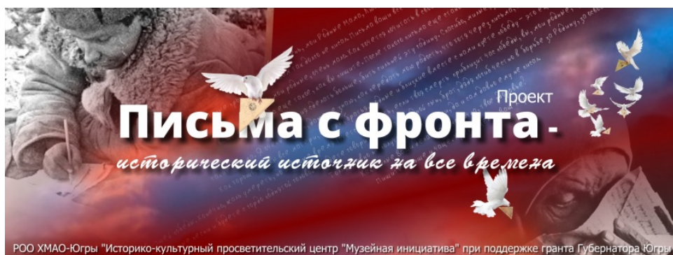
Рис. 4. Раздел сайта (Музей истории и этнографии (Ханты-Мансийский автономный округ – Югра)

Уникальность этого проекта состоит в том, что в научный и публичный оборот введен семейный архив: около 100 писем с фронта, авторами которых являются четыре человека, а получателем – один человек. Известно, что во многих музеях и архивах хранятся письма времен войны, но обычно это одно или несколько экземпляров одного корреспондента. В данном случае большинство писем от двух участников военных действий: младшего сержанта В. М. Виноградова – 80 посланий, написанных в период с 23 февраля 1942 г. по 2 марта 1945 г.; П. Г. Филиппова (служил заведующим продовольственным складом военоторга в Московской области) – 11 писем (8 марта 1942 г. – 5 сентября 1943 г.). И еще 7 писем с фронта от двух корреспондентов. Получатель всех писем – П. М. Рыбальская. Послания эти были случайной находкой: они обнаружены в разрушенном здании г. Тюмени. На сайте даны скан-копии, а также текст в печатной форме, биографические сведения о корреспондентах, их фотографии. Кроме этого, дается анализ текста писем, что повышает исследовательскую функцию проекта. Как считают участники, «изучение писем позволит раскрыть объемный образ “человека войны”, со своим характером, взглядами на жизнь, отношением к войне и победе, чувствами к оставшимся дома родным и близким». Несомненно, оцифрованный архив этих писем – большая удача для