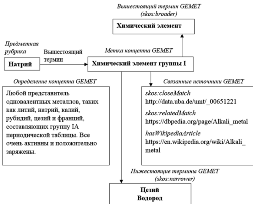
Рис. 2. Пример полученных семантических связей

Несмотря на относительно небольшое количественное пересечение предметных рубрик ЕОАИ с концептами GEMET, установленные связи позволяют обогатить информационную модель ЕОАИ, поскольку значительное их количество связано с рубриками верхнего уровня.