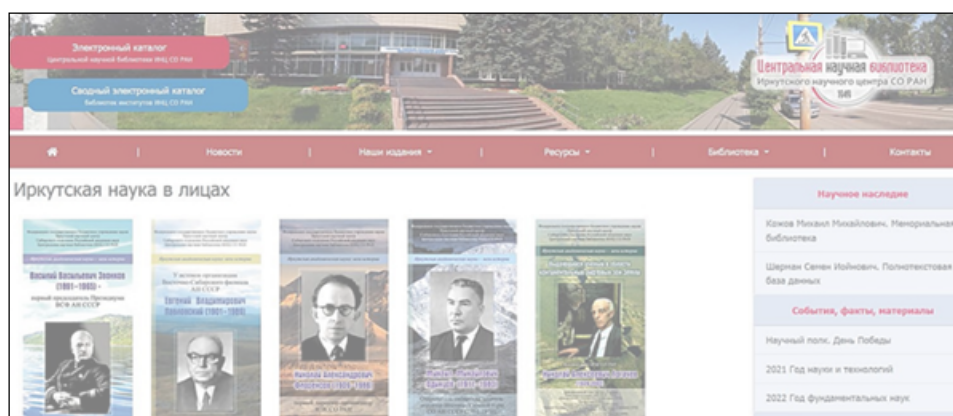
Рис. 1. Фрагмент сайта ЦНБ ИНЦ СО РАН. Раздел: Иркутская наука в лицах

Цель статьи – изложить опыт ЦНБ ИНЦ СО РАН по созданию электронной мемориальной библиотеки ( ЭМБ ) профессора М. М. Кожова, всемирно известного иркутского ученого, обозначить проблемы, выявленные в результате работы, рассказать о дальнейших перспективах использования мемориального ресурса; представить ресурс с точки зрения методико-практического применения итогов информационно-поисковой, исследовательской и организационной деятельности коллектива ЦНБ ИНЦ СО РАН как пример реализации просветительской функции научной библиотеки, показать практическую значимость подобной работы для профессионального сообщества.