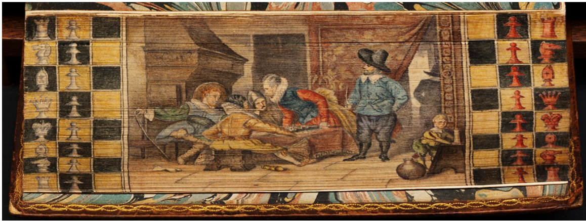
Рис. 2. Филидор, Франсуа-Андре Даникан. Анализ игры в шахматы. С изображением переднего края (веером справа) джентльменов, играющих в шахматы. Коллекция Бостонской публичной библиотеки ( https://publicdomainreview.org/collection/fore-edge-book-paintings-from-the-boston-public-library ) Fig. 2. Filidor F.-A. Danikan. Chess game analysis. With the picture of the front edge (fan on the right) of gentlemen playing chess. Boston Public Library Collection ( https://publicdomainreview.org/collection/fore-edge-book-paintings-from-the-boston-public-library )

формообразующего приема используется шрифт, нередко воспроизводящий «рукописные тексты автора или художника». Наконец, еще одно значимое замечание связано с тем, что эстетический облик книги в целом определяет именно художник, который не просто иллюстрирует сюжет, а создает «особого рода художественный объект» (Мишин, 2012).