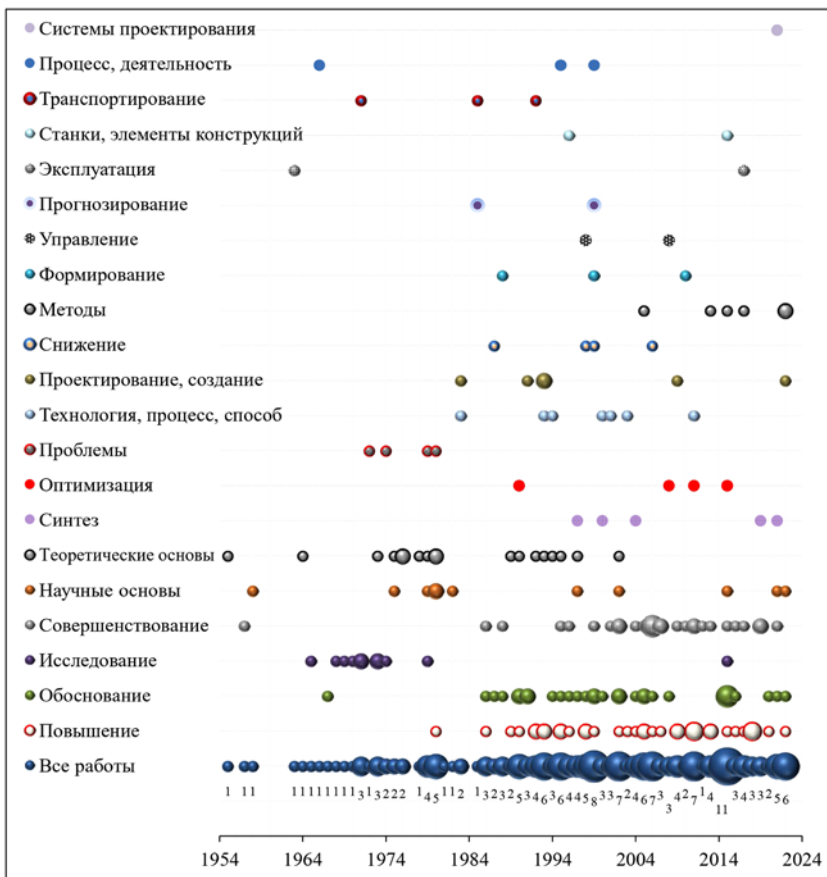
Рис. 1. Распределение диссертаций по первому слову в названиях

Во второй части статьи представлены результаты контент-анализа названий массива диссертаций. Результаты систематизации диссертаций в случае, когда в качестве признака выступает слово (словосочетание), располагающееся в названиях работ первым по порядку слева направо, представлены в виде диаграммы на рис. 1. Нижняя строка –