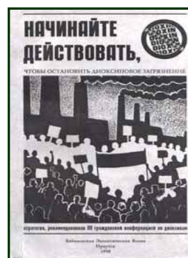
Титульный лист. Начинать действовать, чтобы остановить диоксиновое загрязнение. – Иркутск : Байкальская экологическая волна (БЭВ), 1998. – 184 с.