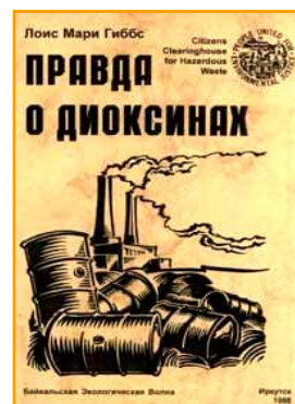
Титульный лист. Гиббс Л. М. Правда о диоксинах. – Иркутск, 1998. – 120 с.