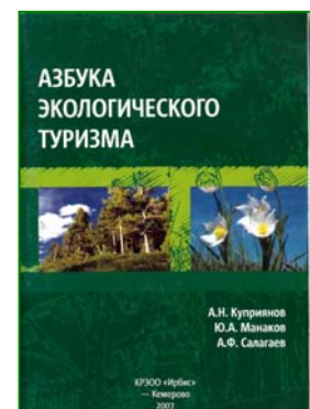
Рис. 4. Издательская продукция Кемеровской региональной общественной организации «ИРБИС» в 2006–2007 гг.