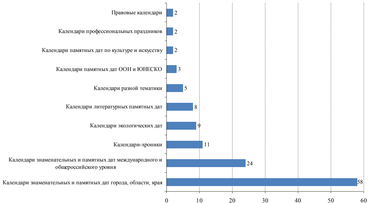
Рис. 3. Распределение календарей по тематике

описание ресурса, перечисляются особенности, дается тематическая характеристика и указывается его целевая аудитория. Предисловия, обращения к читательской аудитории встречаются в 45% рассмотренных пособий.