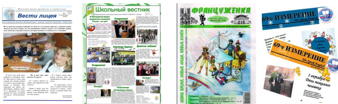
Рис. 1. Информационно-новостная школьная пресса Fig. 1. News and information school press

Фактически многие ученические издания такого рода являются любительской корпоративной прессой, способствующей формированию имиджа образовательного учреждения. Нередко ученические газеты и журналы являются своеобразной визиткой учебного учреждения, что подчеркивают их названия. Например, газета красноярской школы № 69 именуется «69 ярдов», новокузнецкой средней школы № 99 – «99% успеха», издание кемеровской школы № 34 – «На 34 широте», новосибирской гимназии № 132 – «132%». А в новосибирской средней школе № 162 с углубленным изучением французского языка около двух десятков лет выпускается газета «Французенка». Применение указанного приема способствует формированию у учащихся чувства принадлежности к определенной общности, укрепляет микросоциальные связи внутри школы. Кроме того, подобные имиджевые издания зачастую используют «как орган связи с общественностью для того, чтобы утвердить свои успехи в общественном мнении» (Гонне, 2000, с. 33).