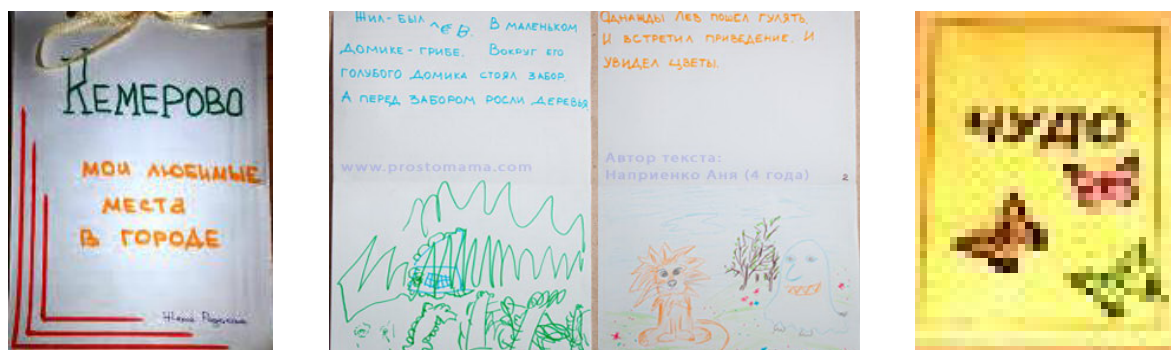
Рис. 4. Детские книжки-самоделки Fig. 4. Children's home-made books

руками» 10 . В якутском селе Сылгы-Ытар в год 90-летия населенного пункта состоялся конкурс «Лучшая книжка-самоделка» 11 .