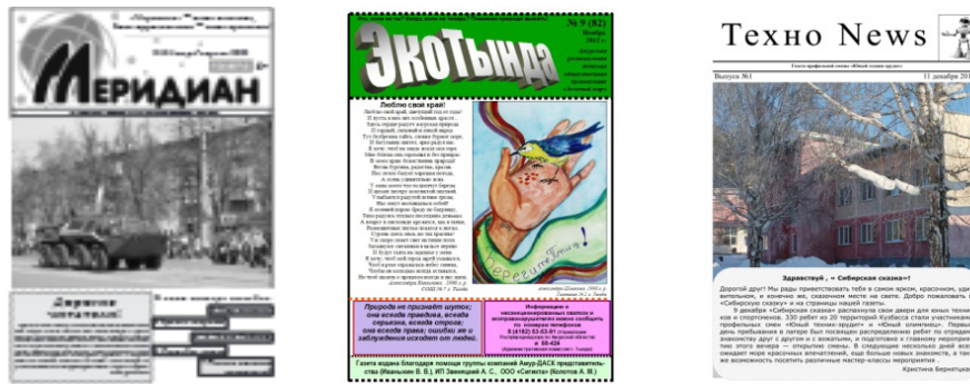
Рис. 2. Монотематическая ученическая пресса Fig. 2. Monothematic pupils' press

Основная функция любительских фанатских журналов (фэнзинов) – трансляция базовых ценностей, норм, образцов поведения неформального сообщества, поддержание групповой идентичности его представителей (Разин, 2010; Савенко, 2014). Фактически фэнзины являются современным альтернативным каналом коммуникации, продолжающим традиции классического самиздата. Содержательная палитра подростковой субкультурной периодики XXI в. отражает многообразие интересов современного молодого поколения. Собственные газеты и журналы издают поклонники панк-рока, приверженцы стрэйт-эйджа, анимешники, ролевики, скинхеды и др. Например, в Красноярске в 2010–2011 гг. фанаты ролевых игр выпускали газету «Поляна Ролевиков Красноярска» 5 . Юная иркутянка Настя издавала в 2007–2011 гг. арт-зины «JAW-JAW» и «Ю-Ю», из которых можно было узнать о том, как сделать маску ниндзя, как рисовать на высоких стенах, зачем нужны дреды и как за ними ухаживать, почему у металлистов длинные волосы и т. д. 6 В Красноярске в 2015 г. за подготовку журнала «Русский Удар», рассчитанного на скинхедов, был задержан пятнадцатилетний подросток. Цель издания – привлечение в субкультурное сообщество новых членов, установление контактов со скин-группировками из других регионов (Чибисова, 2011, с. 105).