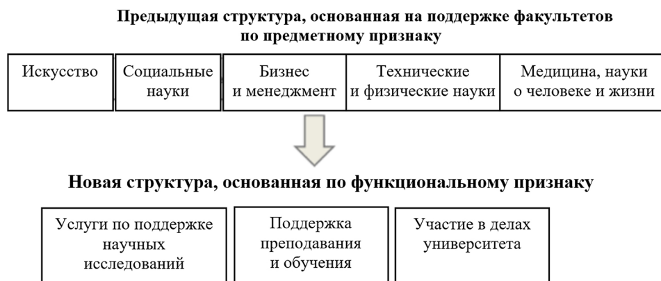
Рис. 1. Сравнение старых и новых структур библиотеки Манчестерского университета (по материалам Bains, 2014)

В течение длительного времени основной характеристикой университетских библиотек в Великобритании и других странах были предметные задачи (Corrall, 2014; Martin, 1996; Woodhead, Martin, 1982), которые, как правило, были сосредоточены на предоставлении комплекса услуг для конкретных учебных подразделений университета. Они часто включали связи с факультетами и кафедрами, работу с книжными фондами и обучение информационной грамотности в этих подразделениях (Brewerton, 2012; Crawford, 2012; Hardy, Corrall, 2007; Pinfield, 2001). Отказ от этих задач в пользу связанных с выполнением конкретных функций в рамках различных дисциплин (включая