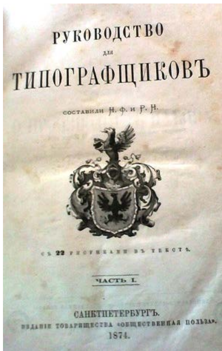
Рис. 2. Н. Ф. и Р. Н. Руководство для типографщиков. Санкт-Петербург, 1874