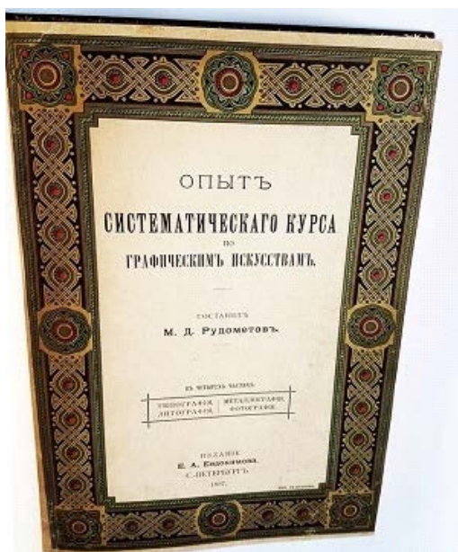
Рис. 5. Рудомётов М. Д. Опыт систематического курса по графическим искусствам. Санкт-Петербург, 1898

Наиболее выдающимся изданием, и вполне заслуженно, является труд М. Д. Рудомётова, увидевший свет в 1898 г., – «Опыт систематического курса по графическим искусствам». Справочная книга и словарь типографских терминов как источник профессиональных знаний могла помочь работникам типографий стать специалистами в своём деле.