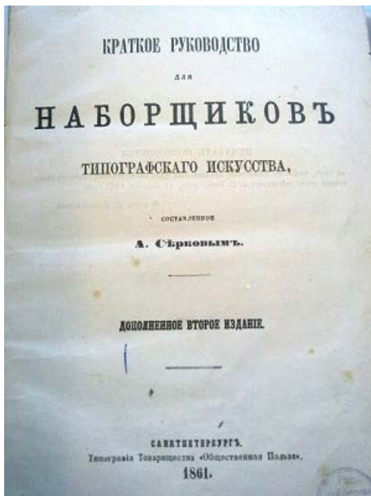
Рис. 1. Серков А. Н. Краткое руководство для наборщиков. Санкт-Петербург, 1861

На русском языке первое специальное издание для работников полиграфического производства «Руководство для наборщиков типографского искусства при спускании полос в разные форматы книгопечатания» А. Н. Серкова впервые появилось в Санкт-Петербурге в 1853 г. Алексей Николаевич Серков (?–1883) – наборщик, сотрудник товарищества «Общественная польза». На основе своего богатого опыта работы в наборном отделении типографии составил небольшое пособие.