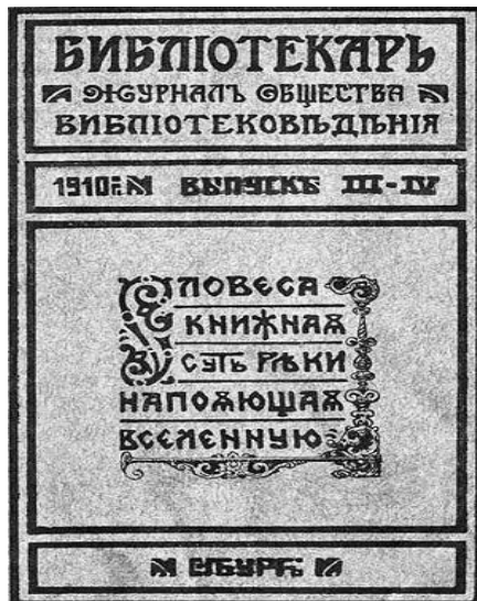
Рис. 1. Обложка первого отечественного журнала по библиотечному делу ( http://www.vivatvictoria.ru/new_year.html )