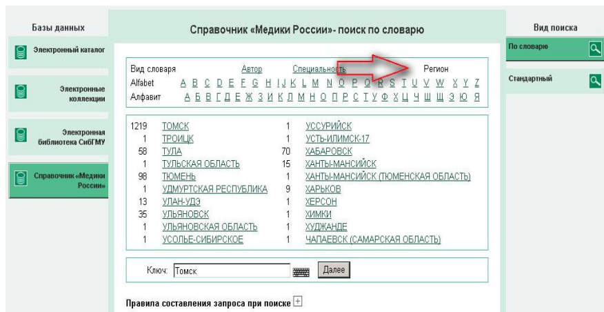
Рис. 2. Справочник «Медики России». Поиск по словарию позволяет отобрать авторов заданного региона/специальности

Результаты поиска. Как сказано выше, библиотекой генерируются разнородные БД. Помимо адаптации поисковых интерфейсов, проведена работа для корректного отображения результатов поиска.