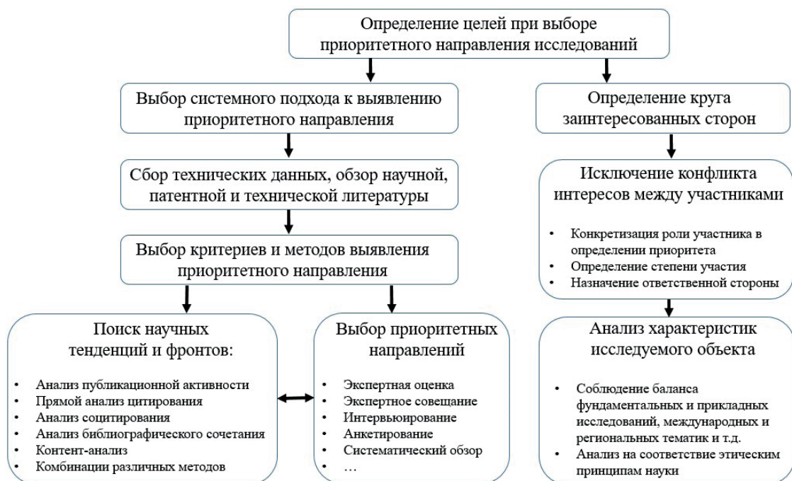
Рис. 1. Схема этапов определения приоритетных направлений научных исследований

Схематически организация выявления приоритетных направлений представлена на рисунке 1, левая часть которого представляет технические этапы поиска приоритетов, а правая – общие условия для объективного подхода к процессу.