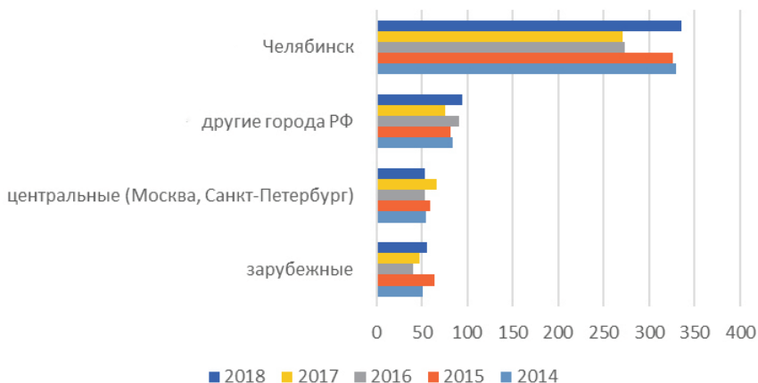
Рис. 2. География публикаций в 2014–2018 гг.

Общая динамика количества публикаций за последние пять лет в периодических, продолжающихся изданиях и сборниках научных конференций с учетом места их издания представлена на рис. 2.